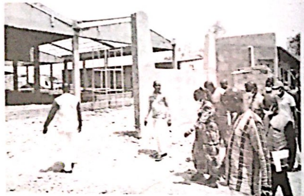
La délégation s'est dit satisfaite de l'évolution des travaux.