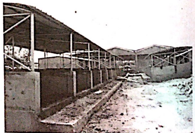
Le marché de Manga, tout comme les autres ouvrages visités, est en phase de finition.