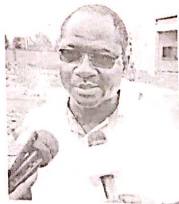
A la fin de la tournée de 48 heures, le coordonnateur national du PADEL se dit globalement satisfait de ce qui a été constaté sur le terrain.