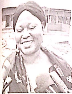
Toute souriante, la responsable des femmes du secteur n°5 de Dedougou se réjouit...

Une équipe du Programme d'appui au développement des économies locales (PADEL), accompagnée des autorités provinciales et régionales, a effectué une sortie-terrain, les 17 et 18 juin 2020, dans la région de la Boucle du Mouhoun. L'objectif était de se rassurer de l'avancée des travaux de réalisation des infrastructures économiques du programme.