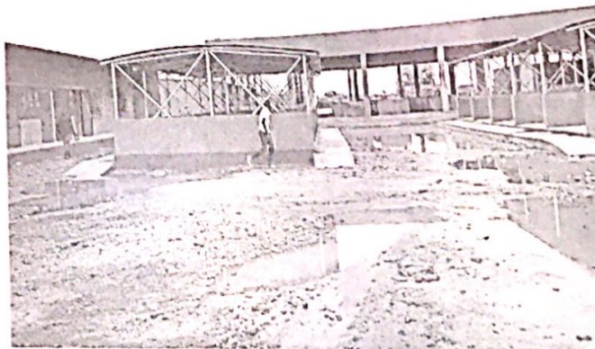
...de la réalisation de ce marché qui sera bientôt mis à leur disposition.

Plusieurs milliards (8 000 000 000) francs CFA, c'est l'enveloppe allouée à la Boucle du Mouhoun pour l'ensemble du Programme d'appui au développement des économies locales (PADEL). Environ cinq milliards de ce budget sont réservés à la construction des infrastructures économiques dans les communes au profit des populations. C'est pour se rassurer de l'exécution de différents chantiers, qu'une délégation du PADEL a fait une sortie-terrain les 17 et 18 juin 2020 dans les communes de Safané et Dedougou dans la province du Mouhoun, Siby, Boromo et Pâ dans la province des Balé, Gassan, Koungny et de Toma dans la province du Nayala, A Safané et Tchériba dans la province du Mouhoun, ce sont des boutiques entièrement réalisées qui ont été visitées à l'occasion de cette tournée de quarante-huit heures. Le hall marchand et les annexes du marché de Siby, l'aire de stationnement de Boromo, les gares routières de Pâ et de Toma, le marché du secteur n°5 de la ville de Dedougou, le site maraîcher de Gassan ont aussi reçu cette délégation qui a constaté l'achèvement des différents travaux de ces infrastructures qui, à court terme, vont venir donner « un coup d'accélérateur » au développement local du territoire du Burkina. Des infrastructures qui donnent déjà de l'espoir. Avant nous nous sommes rendus dans la ville pour visiter nos marchandises,